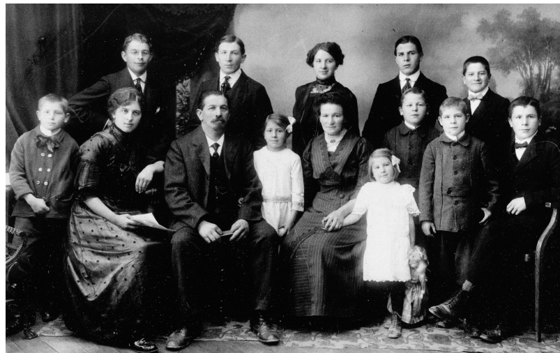
Familienfoto und Ahnentafel aus dem reichen Fundus der Ahnenforscherin.