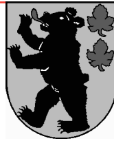
Das Wappen der Familie Bernhard.